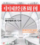
中国经济周刊 2019年17期