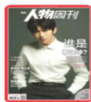
南方人物周刊 2019年28期