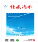
情感读本·上旬刊 2019年9期